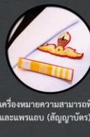
เครื่องหมายความสามารถพิเศษ และแพรแถบ (สัญญาบัตร)