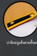
ป่าอินทรชั่งตามชั้นยศ