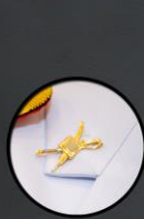
เครื่องหมายเหล่า